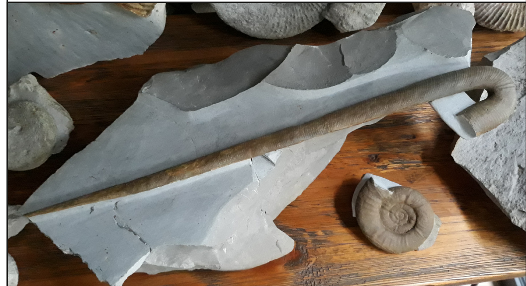
Amorina cincta (d'Orbigny, 1849)