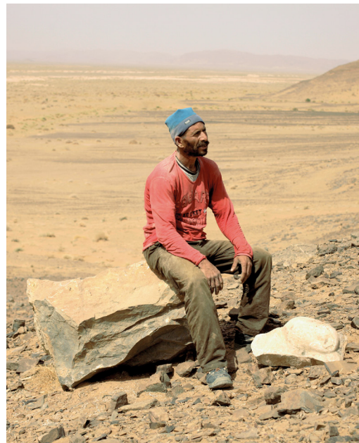
Driss Aroussi, Sisyphé , 2017 Collection Frac Provence-Alpes-Côte d'Azur

Exhibition mixing fossils from our region and modern art.